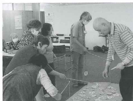
鷓川地区：ゲームの様子