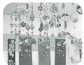
1月・2月のミニギャラリー