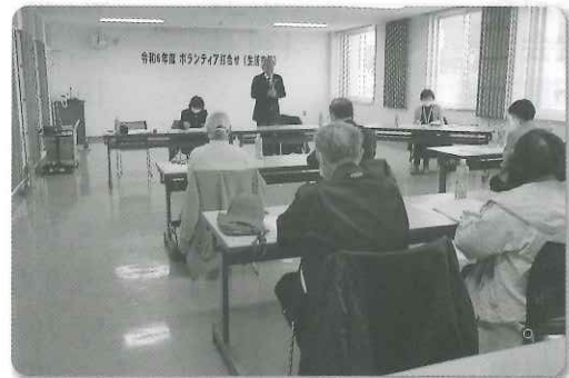
穂別地区：打合せの様子