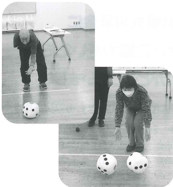
サイコロを転がす様子

身体障害者福祉協会むかわ支部の軽スポーツ新年親睦会を1月27日に四季の館研修室で開催し、20名の会員が参加しました。競技はフライングディスクゲーム等3種目を、2チームに分かれ競いました。今年は追加で「サイコロころころ」ゾロ目が出るの良いことあるかも」と称し、サイコロ二つを同時に転がし、ゾロ目が出ると景品をゲットできる種目を追加しましたが、ゾロ目が出たのは2名でした。残りの景品は北橋副支部長とじやんけんをして、勝った6名の方にお渡ししました。今年も楽しく交流を図ることができました。