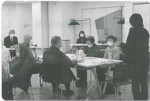
鶴川地区：打合せの様子

ご出席いただいた両地区のボランティアの皆さま、貴重なご意見をありがとうございました。