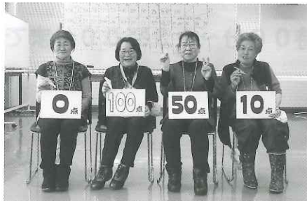
ゲーム優勝チーム

次回のいきいきふれあいサロンは、5月16日(金)に開催を予定しております。参加者の方、ボランティアの方も多数のご参加をお待ちしております。