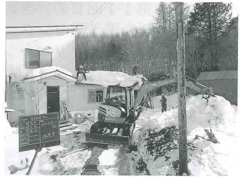
屋根の雪下ろし作業の様子

作業して頂いた山越組の皆さま、周知にご協力いただいた民生委員児童委員の皆さま、ありがとうございました。