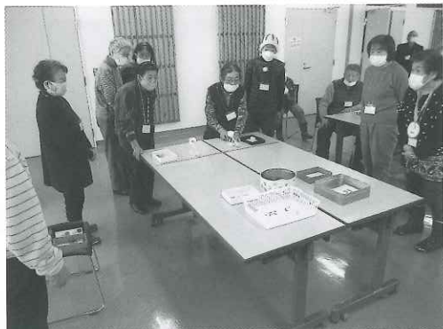
穂別地区：ゲームの様子

「いきいきふれあいサロン」は町内の65歳以上で外出の機会が少なくなつた方を対象に、「ふまねつと運動」やレクリエーション、簡単なゲーム等、参加者全員で楽しく健康づくりを行つていきます。 ボランティアさんが作る美味しい食事も頂けます。多くの皆さんのご参加をお待ちしております。