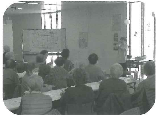
3月のボイストレーニング・口腔体操の様子