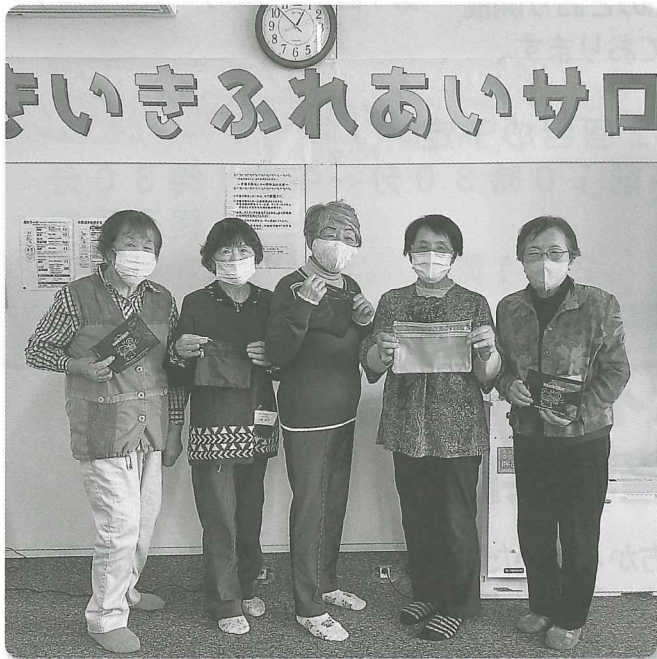
ゲームの優勝チームへ、景品（お薬入れ）を贈呈