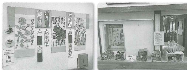
5月のミニギャラリー（一部）

日時：6月23日（日）と7月25日（木） 午後0時00分～午後2時00分 料金：300円