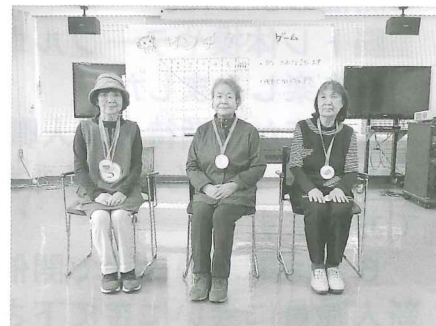
第1回サロンのゲームの優勝チーム

次回（第2回）いきいきふれあいサロンは、下記のとおり開催を予定していますので皆様のご参加をお待ちしております。